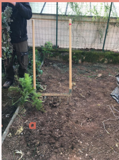
Préparation du jardin, découvertes de ses plantes et plantation de radis - CE2-CM1