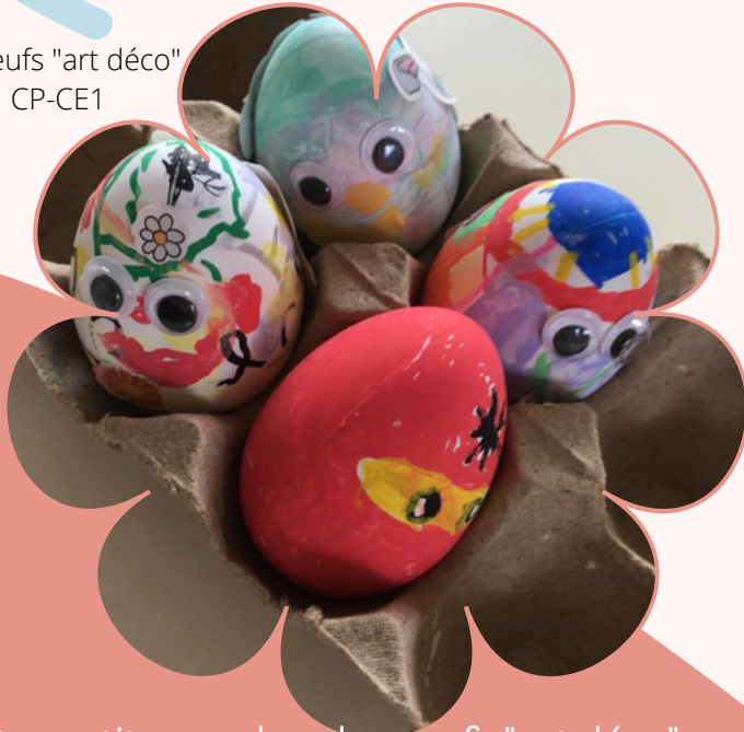
les oeufs "art déco" CP-CE1

Cette quatrième période s'achève, nous nous retrouverons le lundi 25 avril pour la dernière ligne droite de cette année scolaire !