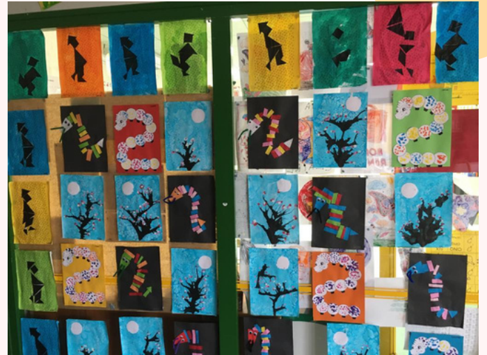
travail de l'Asie - MS-GS